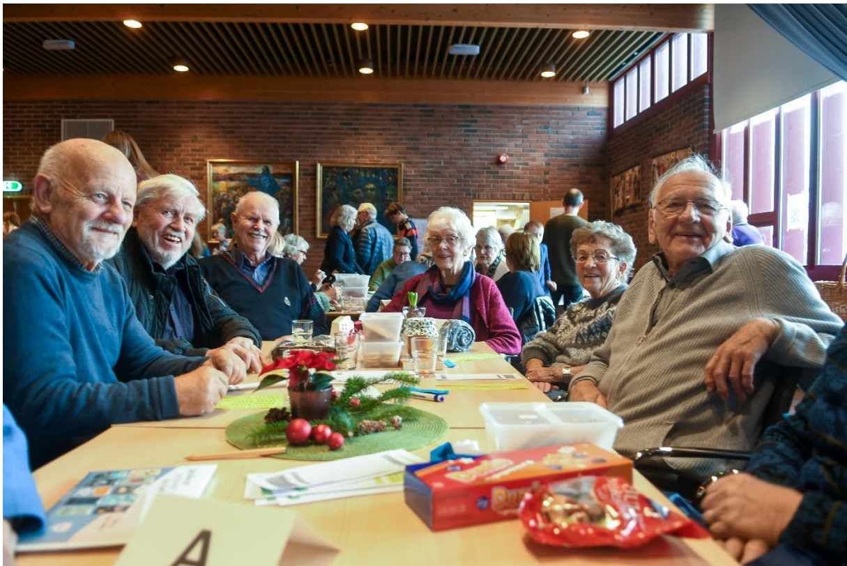
(illustrasjonsbilde – fra julemessen)

Kan vi påstå at for noen er kirkekaffen ukens høydepunkt? Å samles rundt kos og gode smaker, treffe godt kjente og noen nye, på tvers av alder og hverdagsliv, det bygger fellesskap. Tusen takk til kirkeringer, husfellesskap, misjonsforeninger, grupperinger og enkeltpersoner som sørger for at vi har dette møtepunktet! Det er alltid plass til flere på dette laget – og med en nedgang i antall grupper har det blitt mer utfordrende å få dekket opp «kirkekaffe-kabalen».