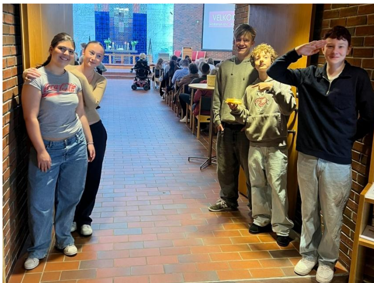
Followme-ungdommene ønsker velkommen til gudstjeneste.

Kr.2700,- fra Fellesrådet for andel av utleieinntekter konsert i Madlamark.